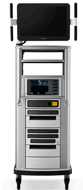
Carro de visión 3D