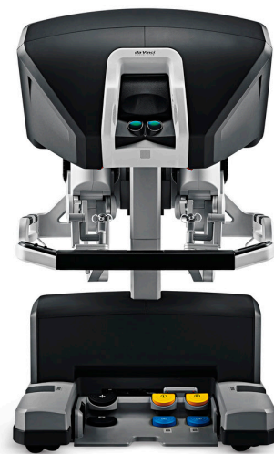
Consola de cirujano